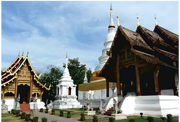
ถาวรวัตถุของวัดพระสิงห์ขวามือคือ อุโบสถสองสงฆ์ ซ้ายมือคือ วิหารลายคำ

พิเศษ เจียจันทร์พงษ์ เสนอไว้ในเรื่อง “ประตุมิและหน้าที่ของพระแก้วมรกต ที่กรุงเทพมหานคร” ๓๒ ว่าพระแก้วมรกตประดิษฐานในพระอุโบสถวัดพระศรีรัตนศาสดารามในพระบรมมหาราชวัง พระอุโบสถหันหน้าตรงกับประตูผีของกรุงเทพฯ (ข้างวัดสระเกศหรือภูเขาทอง) การวางผังอาคารเช่นนี้เหมือนว่ากำหนดหน้าที่ให้แก่วัดพระแก้วมรกตในฐานะสิ่งที่ปกป้องรักษากรุงเทพมหานครให้พ้นจากความชั่วมิให้กลักรายเข้ามาในกรุงเทพฯ พระสิงห์ที่วัดพระสิงห์ จังหวัดเชียงใหม่ก็หันหน้ามาทางทิศใต้ (เมื่อประดิษฐานในอุโบสถสองสงฆ์) ตรงกับประตูสวนปรงซึ่งเป็นประตูผีของเมืองเชียงใหม่เช่นกัน ๓๓ พระสิงห์จะคอยเฝ้าระวังมิให้สิ่งชั่วร้ายอัปมงคลต่าง ๆ เข้ามาสู่เมืองเชียงใหม่ได้