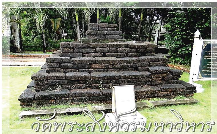
กูบรจอุธิของพญาคำฟู อยู่ใกล้กับอุโบสถสองสงฆ์

พญาผายูทรงสร้างกุ/เจดีย์สำหรับบรรจุพระอัฐิพญาคำฟูและสร้างเป็นวัดชื่อว่า “วัดลีเชียงพระ” เมื่ออัญเชิญพระสิงห์หรือพระพุทธรูปศิลาปางสมาธิมาประดิษฐานที่วัดแห่งนี้ จึงเรียกชื่อใหม่ว่า “วัดพระสิง” (พระสิงห์) จนถึงปัจจุบัน ๑๐ ส่วนคำว่า “ลีเชียงพระ” นั้นได้มาจากคำ ๓ คำรวมกันคือ คำว่า “ลี” หมายถึงตลาด “เชียง” มีความหมายแตกต่างกันไปในแต่ละภาษา ๑๑ โดยทั่วไปภาษาล้านนาคำว่า “เชียง” หมายถึง เมือง หรืออาจจะหมายถึง หมู่บ้าน ก็ได้ ๑๒ และอีกความหมายหนึ่ง “เชียง” หมายถึง ป่า หรือ ดง เช่น เชียงยืน เชียงหมั่น ก่อนที่พญามังรายจะทรงสร้างเชียงใหม่ ๑๓