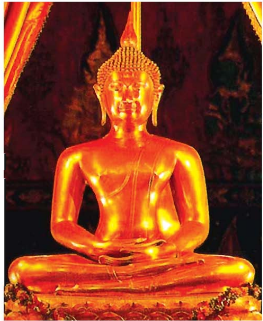
พระพุทธรูปทองคำ กรุงเทพมหานคร

พระสิงห์หายไปครั้งที่ ๔ สมัยรัตนโกสินทร์ พ.ศ. ๒๓๓๘ พระบาทสมเด็จพระพุทธยอดฟ้าจุฬาโลกโปรดฯ ให้สมเด็จพระอนุชาธิราช กรมพระราชวังบวรมหาสุรสิงหนาทยกกองทัพหลวงมาช่วยขับไล่พม่าออกจากเมืองเชียงใหม่ กองทัพสยามตีกองทัพพม่าแตกพ่ายไปแล้ว เมื่อสมเด็จพระราชวังบวรฯ จะเสด็จกลับได้อัญเชิญพระพุทธรูปทองคำจากเชียงใหม่ลงมาประดิษฐานที่กรุงเทพมหานคร พระพุทธรูปทองคำจึงหายไปจากเชียงใหม่อีกครั้งหนึ่งและครั้งนี้ชาวเชียงใหม่มิได้ติดตามเอากลับคืนมาแต่อย่างใด คงเนื่องด้วยเหตุผลทางการเมืองที่เชียงใหม่เป็นเมืองประเทศราชของกรุงเทพฯ ผู้เขียนสันนิษฐานว่า ชาวเชียงใหม่เรียกพระพุทธรูปทุกองค์ที่มีพุทธลักษณะเป็นศิลปะเชียงแสน ปางมารวิชัย ขัดสมาธิเพชรว่า “พระสิง” แต่พระสิงห์องค์ที่อัญเชิญไปกรุงเทพมหานครนั้นเป็นพระพุทธรูปปางสมาธิ ขัดสมาธิราบ ตรงตามพุทธลักษณะของพระพุทธรูปแบบลังกา และตรงตามที่