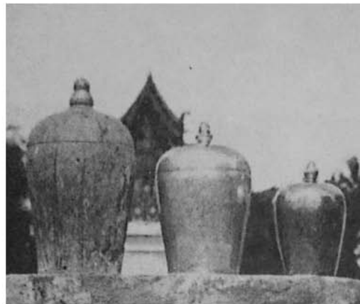
โกบริบรรจุพระอัฐิพญาคำฟู