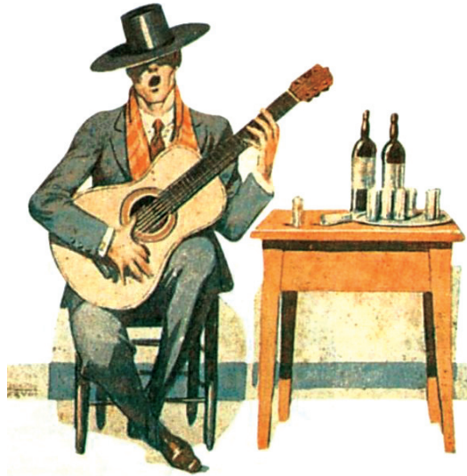
การเดี่ยวกีตาร์

ยิบรอลตาร์ (Gibraltar) : ทุกวันนี้สหราชอาณาจักร ๑ ยังคงมีฐานทัพเรือเล็ก ๆ เพื่อรักษาช่องทางเดินเรือที่จะเข้าสู่ทะเลเมดิเตอร์เรเนียน ที่มีเขาสูงตระหง่านเป็นจุดเด่น ที่มีชื่อว่า Hercules pillar