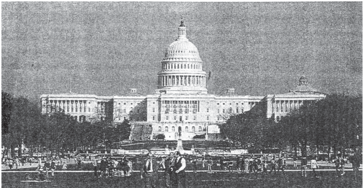
ตึกรัฐสภาสหรัฐอเมริกา ในกรุงวอชิงตัน ดี.ซี. ใช้เป็นที่ประชุมรัฐสภามาตั้งแต่ ค.ศ. ๑๘๐๐ จนถึงปัจจุบัน