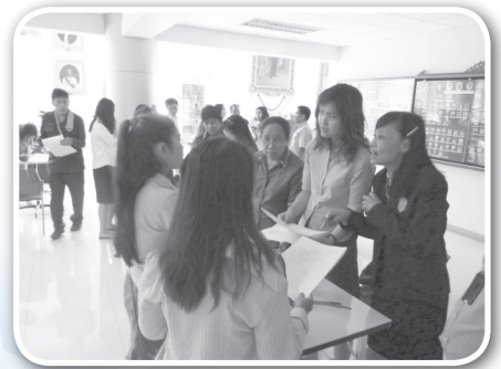
ภาพบรรยากาศการรับแจกหนังสือการ์ตูน รู้ รัก ภาษาไทย ชุดแมวไทย ณ ที่ทำการราชบัณฑิตยสถาน ซึ่งมีประชาชนทั่วไปให้ความสนใจและเดินทางมาขอรับหนังสือการ์ตูน รู้ รัก ภาษาไทย ชุดแมวไทย เป็นจำนวนมาก