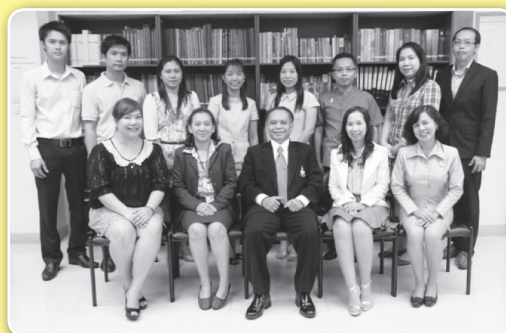
คณะทำงานโฆษกราชบัณฑิตยสถาน