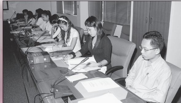
การประชุมเชิงปฏิบัติการถ่ายทอดความรู้ภายในองค์กรเพื่อใช้ในการปฏิบัติงานและการให้บริการ

***ราชบัณฑิตยสถาน ขอแสดงความเสียใจและอาลัยที่ ดร.อภิชาติ วงศ์แก้ว ภาควิชาศิลปกรรม ภาควิชาสถาปัตยกรรมศาสตร์ สาขาวิชาการศึกษา กรุงเทพมหานคร ถึงแก่กรรม เมื่อวันที่ ๑๔ กันยายน ๒๕๕๙ ตั้งศพสวดพระอภิธรรม ณ วัดมกุฏกษัตริยาราม ทั้งนี้ ราชบัณฑิตยสถานได้เป็นเจ้าภาพสวดพระอภิธรรมในวันจันทร์ที่ ๒๕ กันยายน ๒๕๕๙***